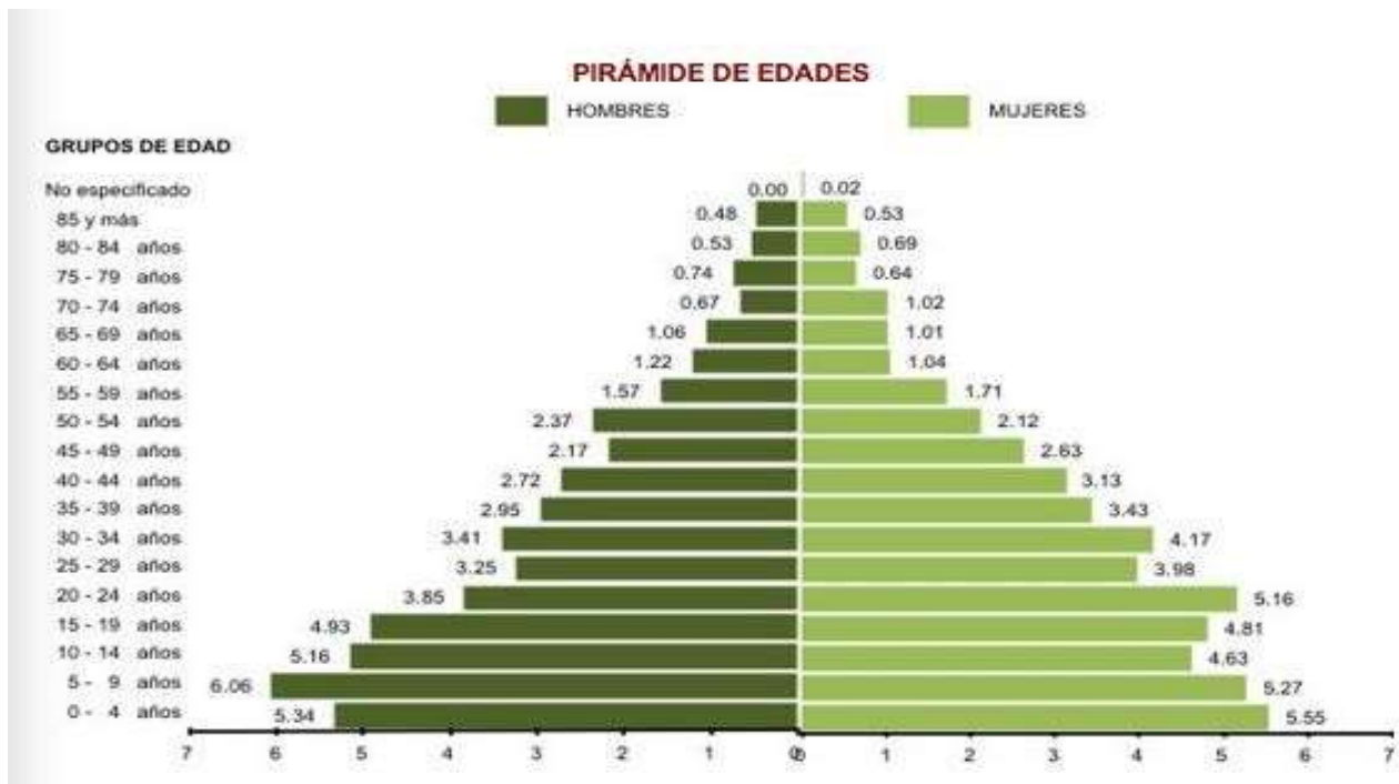
Figura 1. Pirámide de edades